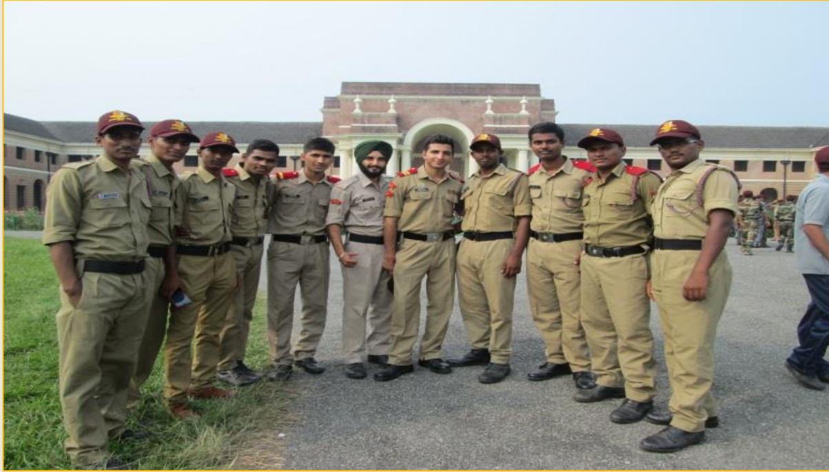
NCC Cadets of Veerashaiva College at All India Doon Treacking Camp (Utterakhand) from 12/09/2015 to 30/09/2015