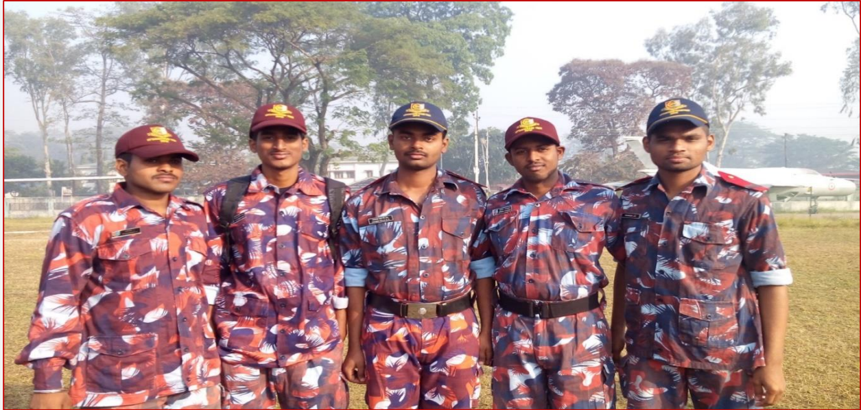
NIC Tezpur 21/12/2015 to 04/01/2016