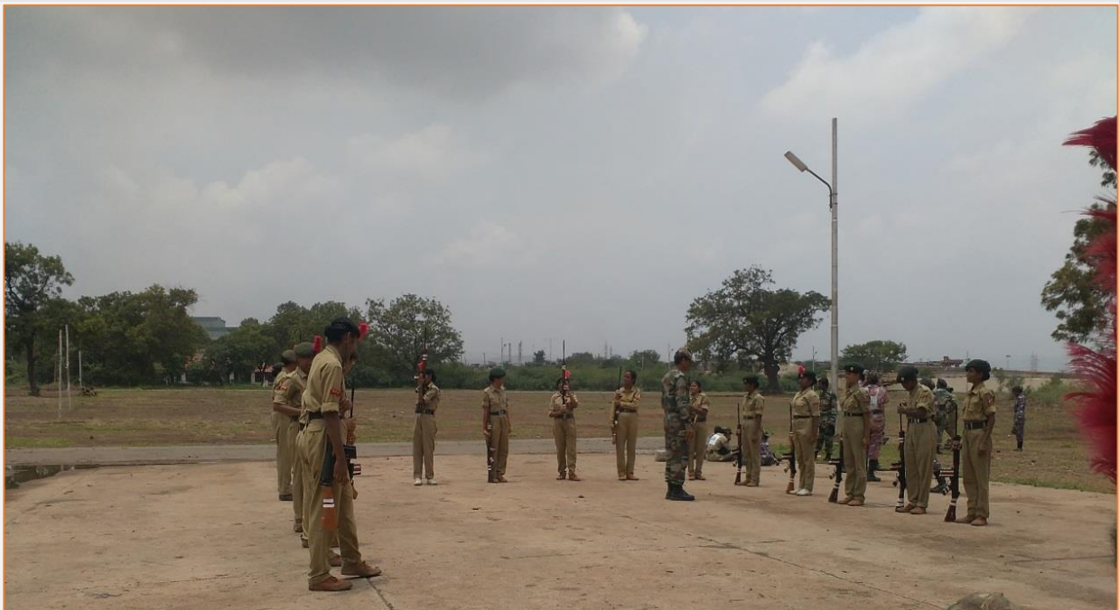
CATC Thornagallu from 12/08/2015 to 21/08/2015