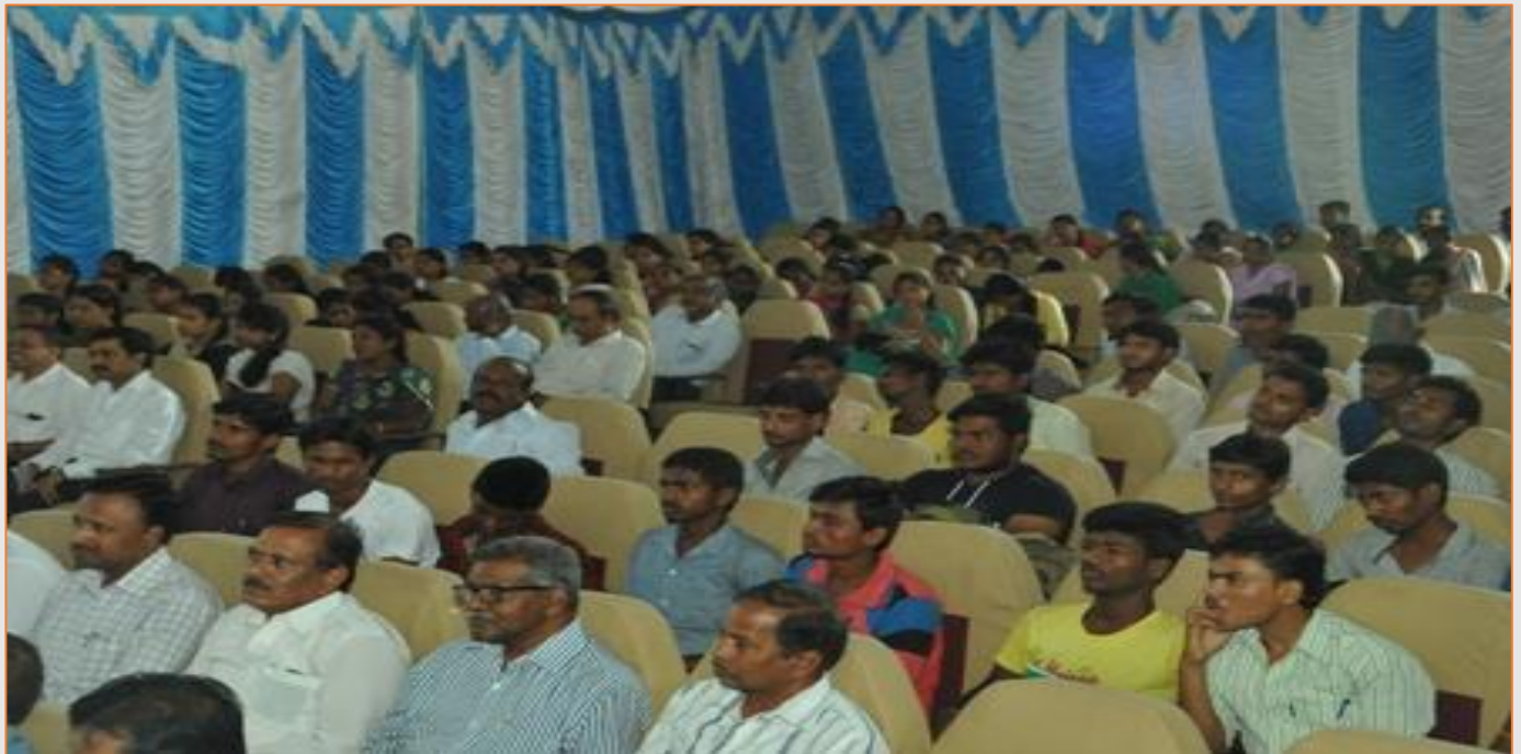
A Section Audience in the Seminar