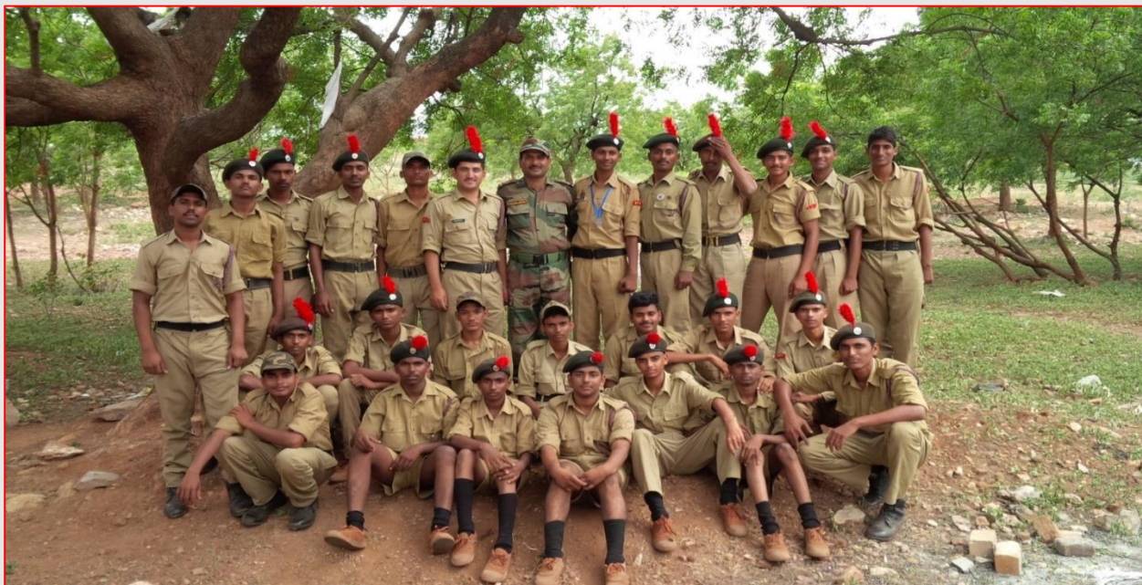
Inter Battalion TSC Camp – 2015 January 19, 2015